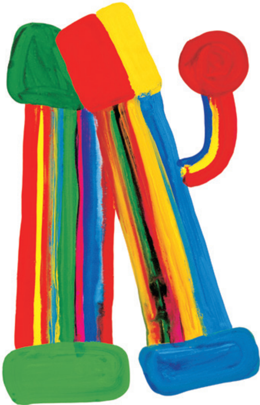
Mon atelier des couleurs, Gyong-Sook Goh, texte de Ho-Baek Lee, 2006.

médiathèque française sagan du 15 novembre 2022 au 19 mars 2023