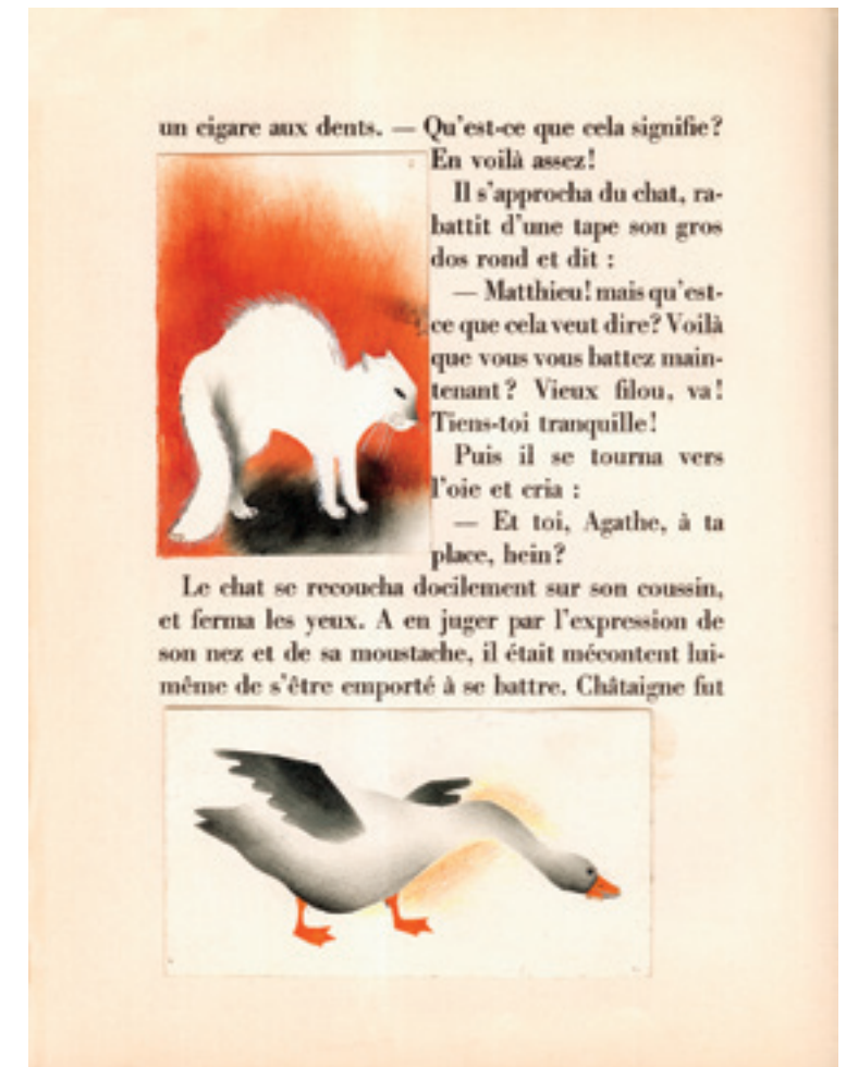
L'exemplaire utilisé par Nathalie Parain pour coller ses originaux.