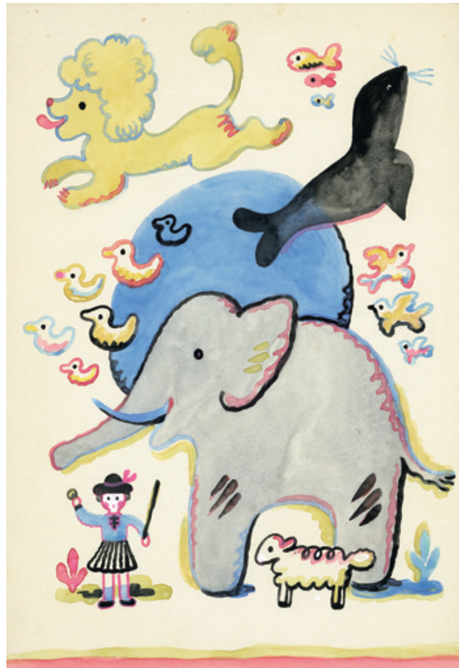
Gouache pour The Gay ABC, Françoise Seignobosc, Charles Scribner's Sons, 1939 (fonds patrimonial Heure joyeuse). Réédition Alphabet galopin, MeMo, 2015.