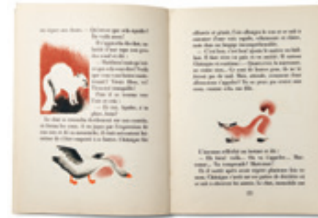
Première édition de Châtaigne , Nathalie Parain, texte d'Anton Tchekhov, NRF, 1934.