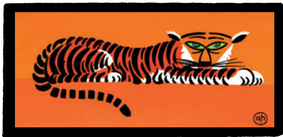
Drôles de bêtes, André Hellé, éditions MeMo, 2011. Première édition, Paris, A. Tolmer et Cie, 1911. Consultable dans le fonds patrimonial Heure joyeuse.

Les ouvrages choisis participent à l'écriture de l'histoire de l'art des livres pour enfants. Ce sont des livres dont la modernité au moment de leur parution initiale garde toute son acuité dans les mains des enfants d'aujourd'hui. Ces publications sont autant de jalons créatifs, inspirés par les avant-gardes artistiques ou œuvres de grands photographes, qui ont radicalement renouvelé le livre d'images et nourrissent encore la création contemporaine. Leur réédition nécessite en amont un important travail de documentation, de retour aux sources (retrouver la première édition, ainsi que les dessins originaux), de traduction et de fabrication (typographie, maquette, impression, façonnage) pour faire revivre ces trésors avec la justesse des traits et couleurs pensés par leurs créateurs. Ce travail de précision a fait connaître les éditions MeMo, et son difficile équilibre financier suppose un engagement opiniâtre pour faire sortir de l'oubli et reconnaître ces livres. Ce double ancrage dans l'histoire de la modernité et la création contemporaine est constitutif de l'identité de MeMo.