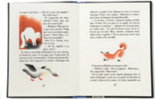
Réédition aux éditions MeMo en 2009.